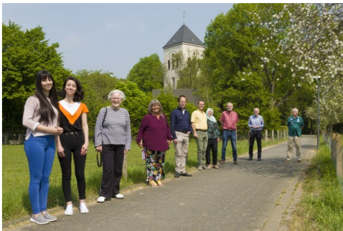
O grupo de voluntários e refugiados patrocinados em Colônia-Merheim.

Após receber na Alemanha os primeiros refugiados patrocinados, em 2019, o grupo de patrocínio de Colônia ligado à campanha Novos Vizinhos, da paróquia de São Gereão, decidiu patrocinar outra família. A primeira,